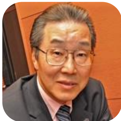
上原 修 教授

加速度的にスピードを増し、かつ複雑化する環境変化を前提とした時代に生きる次世代のビジネスリーダーにとってサプライチェーンマネジメントのスキルを磨くことはマストです。